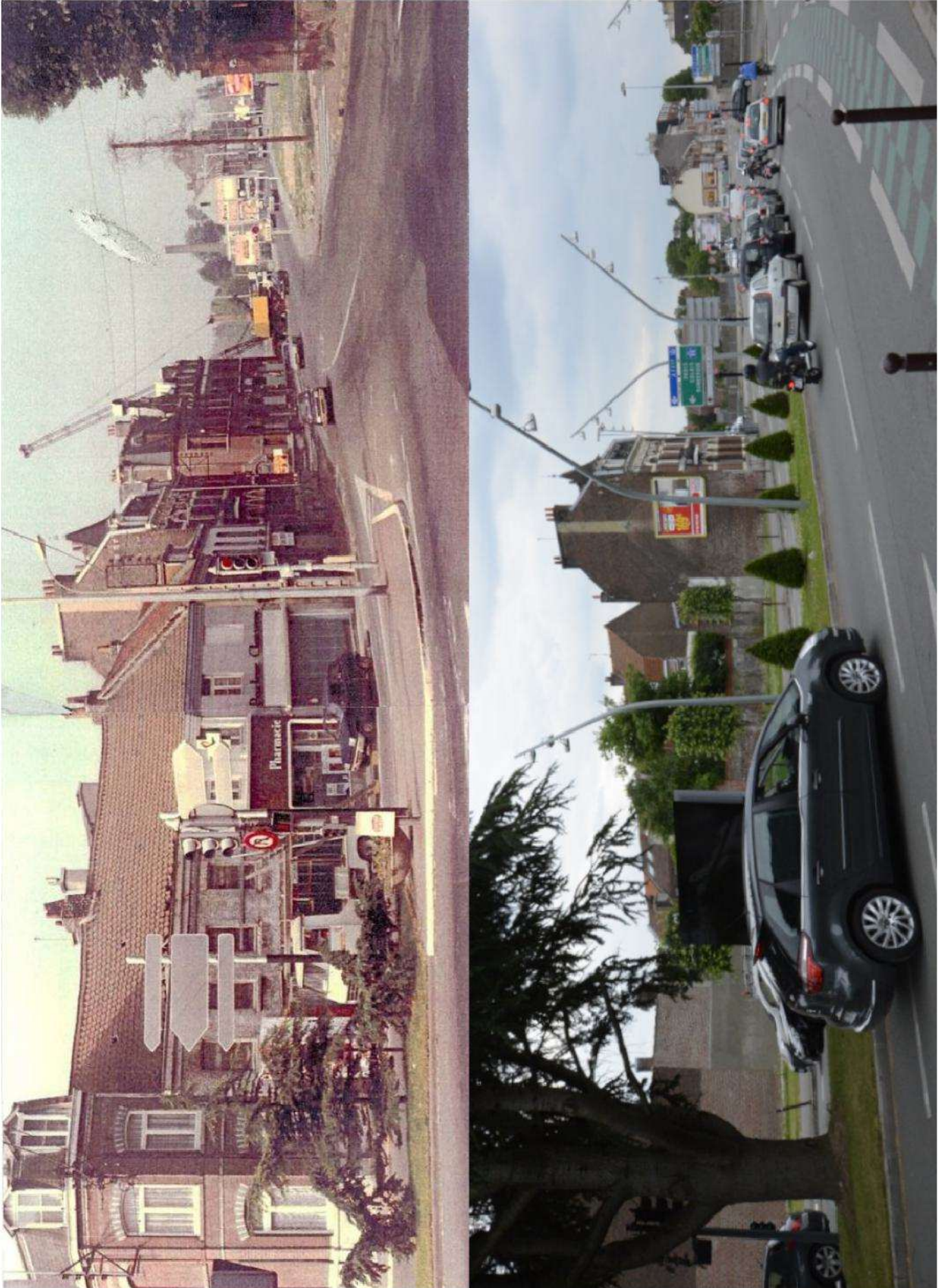
Quartier du Lion d'Or. Remarquez la taille de l'arbre aujourd'hui.