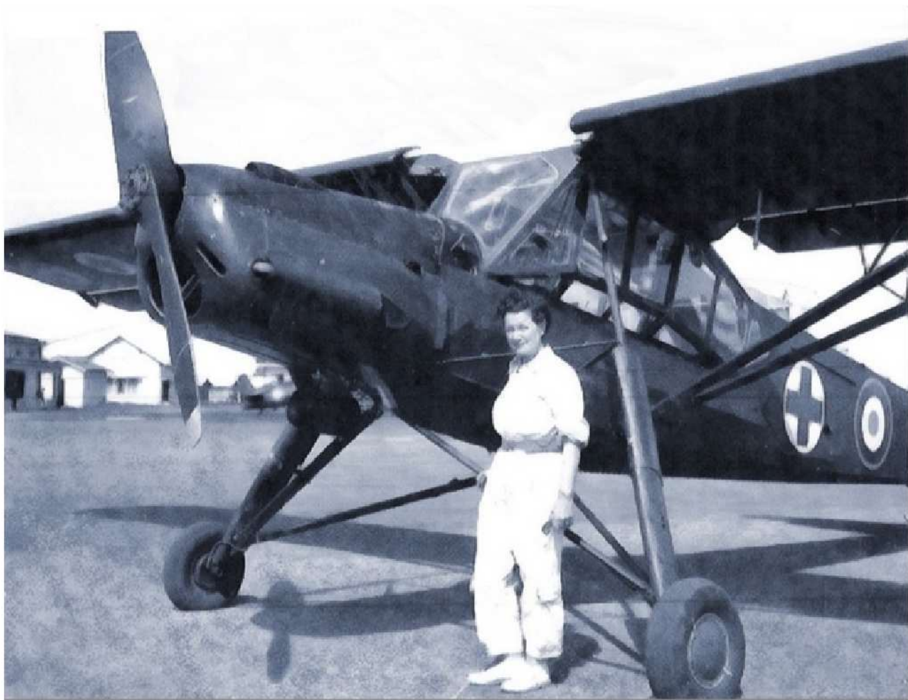
1954, mission sur Morane 500

Le plus dur, ce sont les missions de réglage de tir d'artillerie. Non pas à cause de la précision que cela exige mais parce qu'elle participe directement à l'action de la mort liée à la guerre. Le problème moral est terrible pour une femme !