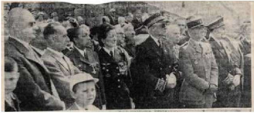
1957, commémoration de la Résistance dans une ville de l'est, Joséphine Baker au côté de Suzanne Jannin, Photo de presse Est républicain