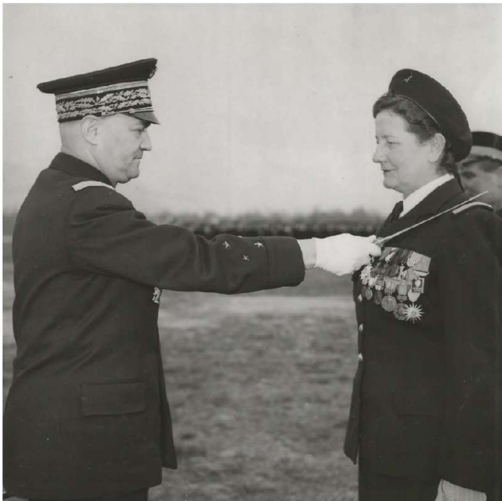
1955, Légion d'honneur et médaille militaire attribuées par le Général Chassin, Photo des armées